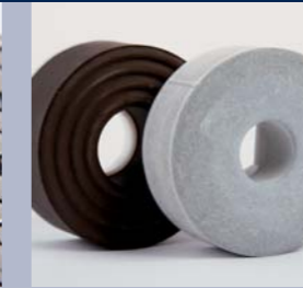
Mineraalgebonden nat en droog slijpstenen