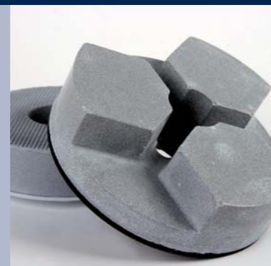
Minerale slijpstenen voor Floater - KSL - automaten

CNC gestuurde bewerkingsmachines – speciaal diamantgereedschap voor specifieke oplossingen