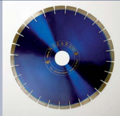
Performer Matrix voor graniet en kwarts

Brugzaagmachines – hoogwaardige diamantzaagbladen met uitstekende zaageigenschappen