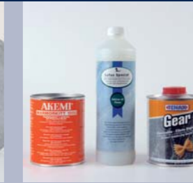
Chemische producten van Akemi, TENAX en Vido