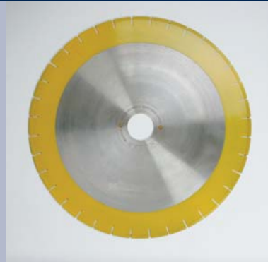
Diamantzaagbladen voor marmer en kalkzandsteen