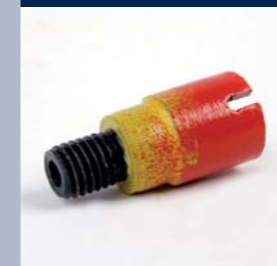
Stiffrezen voor spoelbakuitsparingen

Handgestuurde bewerkingsmachines – beproefde diamantproducten voor de meest uiteenlopende bewerkingen