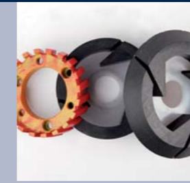
Diamant gereedschap voor cascaden