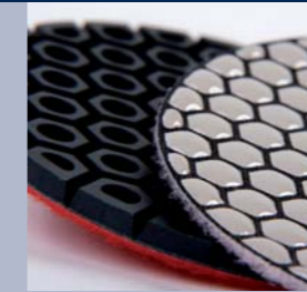
Euro Space en Euro Dry Space voor nat en droogslijpen