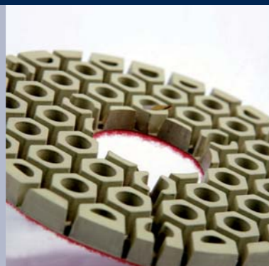
Euro Space voor het polijsten van graniet, kwarts en marmer op alle kantenautomaten