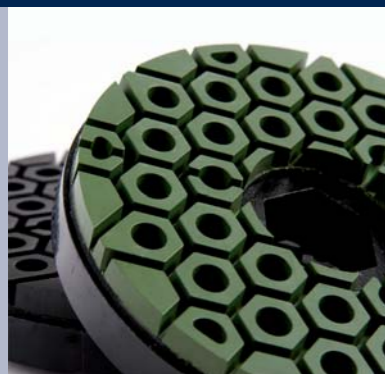
Euro Space voor het polijsten van graniet en marmer op alle kantenautomaten

Kantenautomaat – efficiënt slijpen en polijsten voor een perfecte glans en kleurdiepte